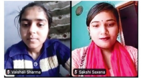
डिग्री कॉलेज की वेब संगोष्ठी में भाग लेती मुख्य वक्ता व छात्राएं